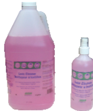
Y51P: 500 ml

Le papier Y320 est ultra fort et résistant. Lorsqu'il est mouillé, il est aussi doux que des mouchoirs en papier. Ne laisse pas de résidu sur les lentilles et ne raye pas le plastique ou le polycarbonate. Taille du papier 11.4 cm X 21.5 cm. 280 feuilles/pqt, 30 pqt/boîte.